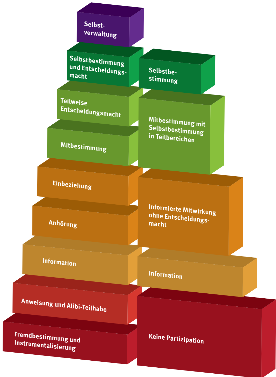
Abbildung 1: Partizipationsstufen